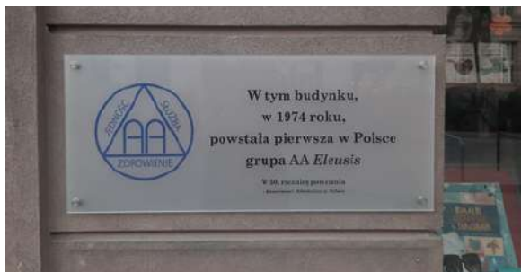
Tablica upamiętniająca powstanie pierwszej w Polsce grupy AA

Z myślą o 50-leciu został przygotowany film o Anonimowych Alkoholikach obalający mity na temat AA. Premierowy pokaz obył się podczas mitingu otwarcia, który w całości był tłumaczony na Polski Język Migowy – to, po pierwsze, robiło spore wrażenie, a po drugie, dzięki nagraniu będziemy mogli ten najnowszy film na stałe wzbogacić o tłumaczenie na PJM. Co do językowych udogodnień, mieliśmy też symultaniczne tłumaczenie na dwa języki: angielski i rosyjski.