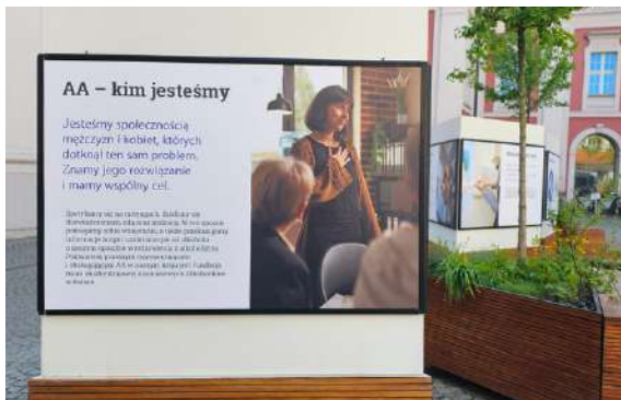
Wystawa „50 lat Anonimowych Alkoholików” na Placu Kolegiackim w Poznaniu. Lipiec 2024