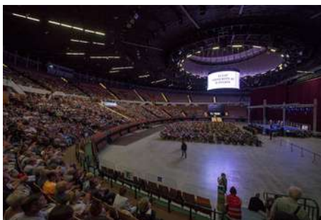
Konwencja AA w Katowicach, 45-lecie AA w Polsce, 2019 rok