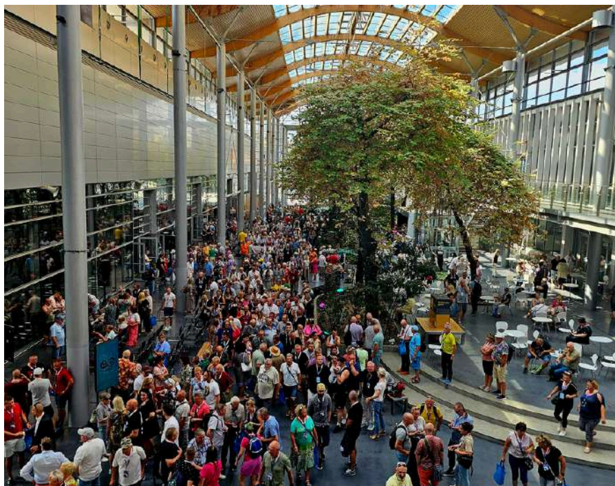
Aleja Lipowa na terenie MTP, jedno z głównych miejsc spotkań uczestników 50-lecia AA w Polsce, sierpień 2024 rok

Większość członków AA świętowała przez dwa, trzy dni, lecz kilkudziesięciu wolontariuszy, osób służących w zespołach zadaniowych, powiernicy i pracownicy Biura Służby Krajowej AA w Polsce, a także nasi Przyjaciele-profesjonaliści trudzili się przy organizacji tej konwencji przez kilka miesięcy, a nawet lat. Krótkim podsumowaniem ich wysiłków możemy zamknąć ten okres i pozostać z pełnym wdzięczności wspomnieniem tego ważnego dla nas wydarzenia.