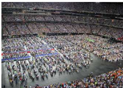
Konwencja AA w Atlancie, 80-lecie istnienia AA, 2015 rok

Amerykańskie konwencje rocznicowe przyciągają po parędziesiąt tysięcy odwiedzających z całego świata. W 2015 roku w Atlancie spotkało się 57 tysięcy osób. Czyli prawie dziesięć razy więcej niż w Polsce. Uczestnicy mają do dyspozycji w zasadzie całe miasto, spotkania i imprezy odbywają się w różnych jego punktach, jest wiele wydarzeń towarzyszących, a miasto chętnie uczestniczy w takim jubileuszu. Można by powiedzieć, że to niemal zewnętrzna impreza. Pamiętajmy jednak, że społeczna świadomość istnienia AA w Stanach Zjednoczonych jest zdecydowanie inna niż u nas.