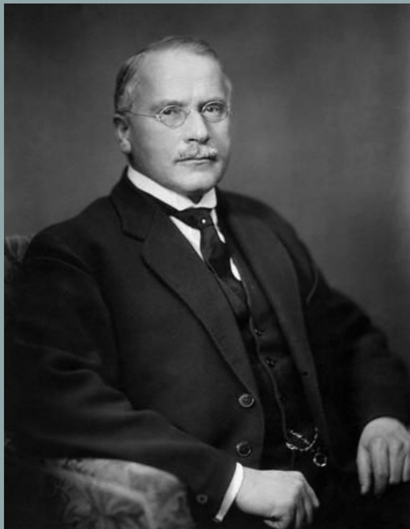
Carl Gustav Jung w 1922 roku.