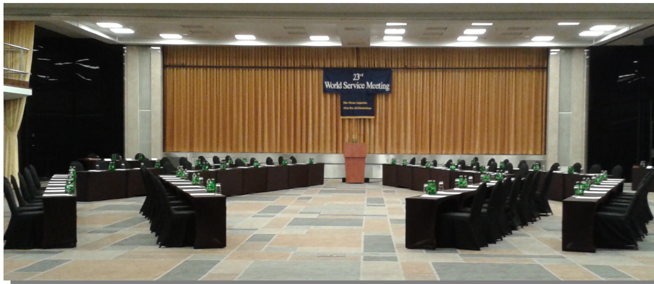
Fot. Sala obrad 23. ŚMS Sofitel Victoria 2014 r.

W dniach 12-16 października 2014 roku w hotelu Sofitel Victoria w Warszawie odbył się 23. Światowy Mityng Służb Anonimowych Alkoholików, którego organizatorem była Rada Powierników AA na USA i Kanadę.